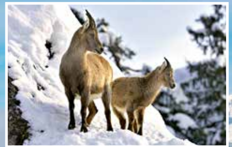
Natur- und Tierpark Goldau Wenn das Murmeltier schläft