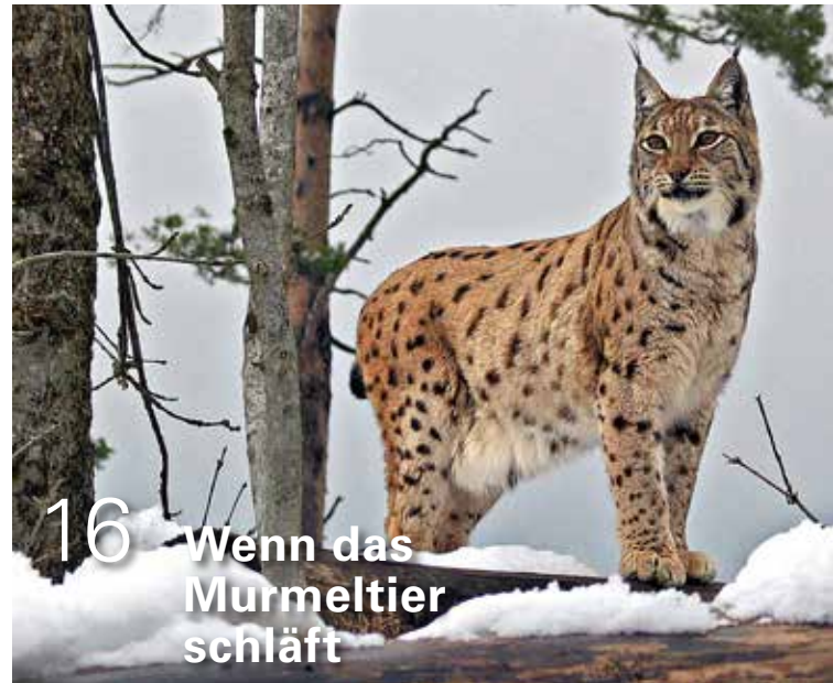
16 Wenn das Murmeltier schläft