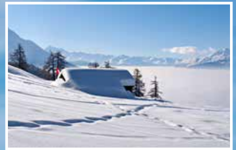
Tierspuren im Winter Rücksichtsvoll durch den Landschaftspark Binntal

Das Magazin für naturbewusstes und nachhaltiges Leben in der Schweiz.