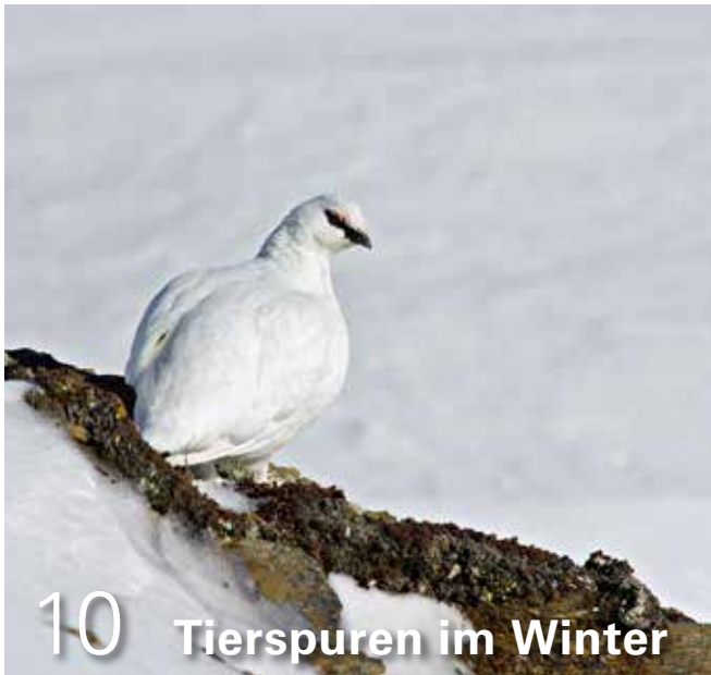
10 Tierspuren im Winter