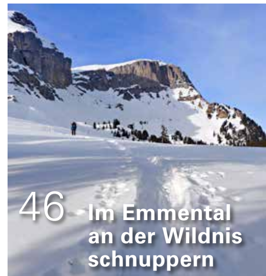
46 Im Emmental an der Wildnisschnuppern