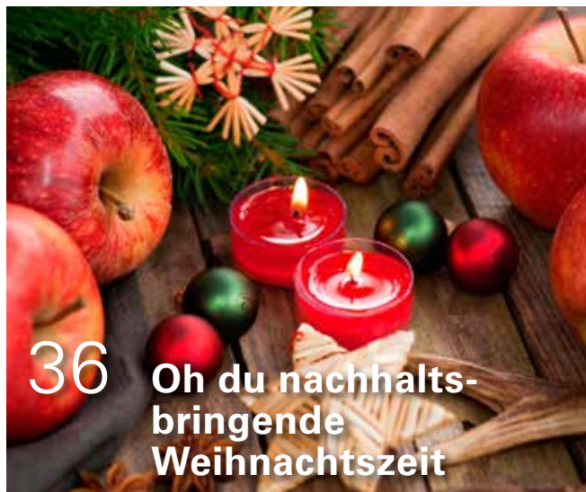
36 Oh du nachhaltsbringende Weihnachtszeit